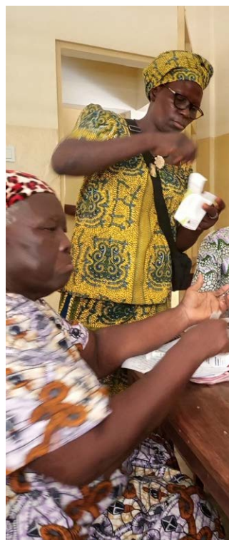
Distribution des médicaments