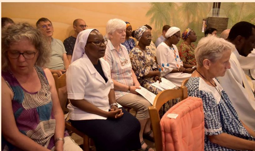
Des membres de la Famille Brésillac