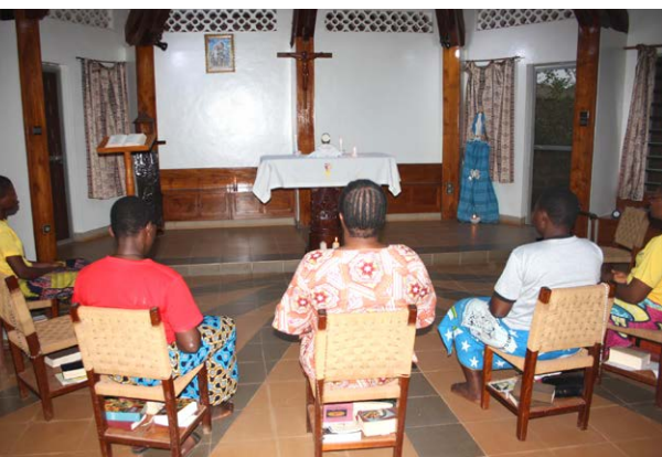
Dans la chapelle de Parakou

L'adoration eucharistique est le pilier et le centre de notre vie de prière. Nos Constitutions le rappellent clairement : « Pour féconder leur laborieux apostolat, les Sœurs ont besoin d'une vie spirituelle intense. À cette fin, l'Institut attachera la plus grande importance à l'Adoration du Saint-Sacrement. »