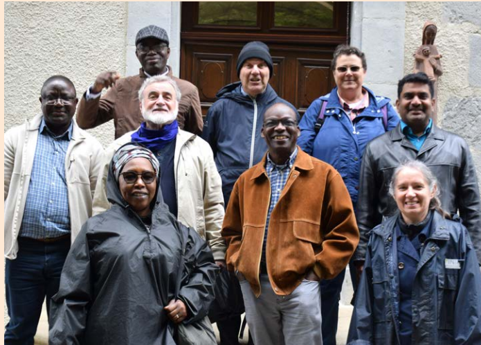
Rencontre des Conseils de la Famille Brésillac

Les marques propres des SMA, NDA et MCS-C tiennent compte d'un « esprit de famille » qui se vit, si possible dans les faits et toujours dans l'esprit, par la mission ad extra (hors des limites géographiques d'origine), ad gentes (annoncer l'Évangile aux « gentils », aux non-chrétiens), ad vitam (en s'engageant pour toute la vie) et selon des spécificités (société de prêtres et serments, congrégations religieuses et vœux, en particulier). Dans