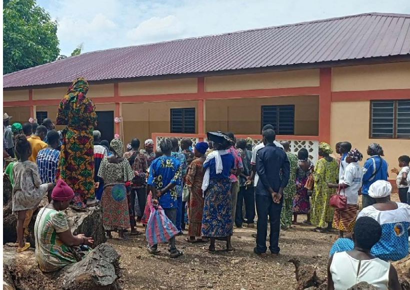
Devant le nouveau bâtiment