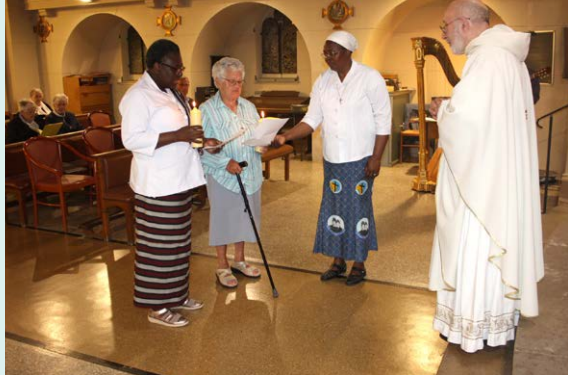
Renouvellement des vœux

« Ne crains pas, car je suis avec toi ! » Isaïe 41,10