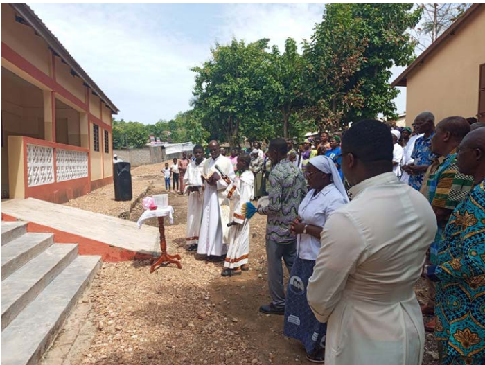
Bénédiction du nouveau bâtiment

Les Sœurs Missionnaires Catéchistes du Sacré-Cœur, qui sont arrivées à Yadè en 1939, ne seront jamais oubliées. Toutes ces femmes se sont dévouées au développement de la région à travers la promotion féminine et les activités sanitaires dans les villages et leurs environs.