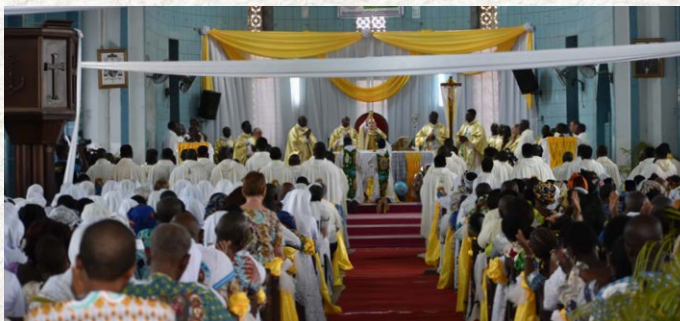
Messe de Jubilé