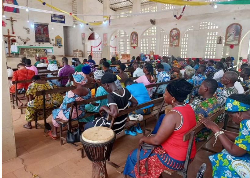
Au cours de la Messe

Au-delà des honneurs et des avantages matériels et financiers, prendre soin des malades comme le Seigneur prend soin de son peuple : voilà ce qui fera la différence entre ce centre et les autres centres publics et profanes, a-t-il ajouté.